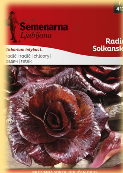
SOLKANSKI RADIČ- AVTOHTONA VRSTA RADIČA