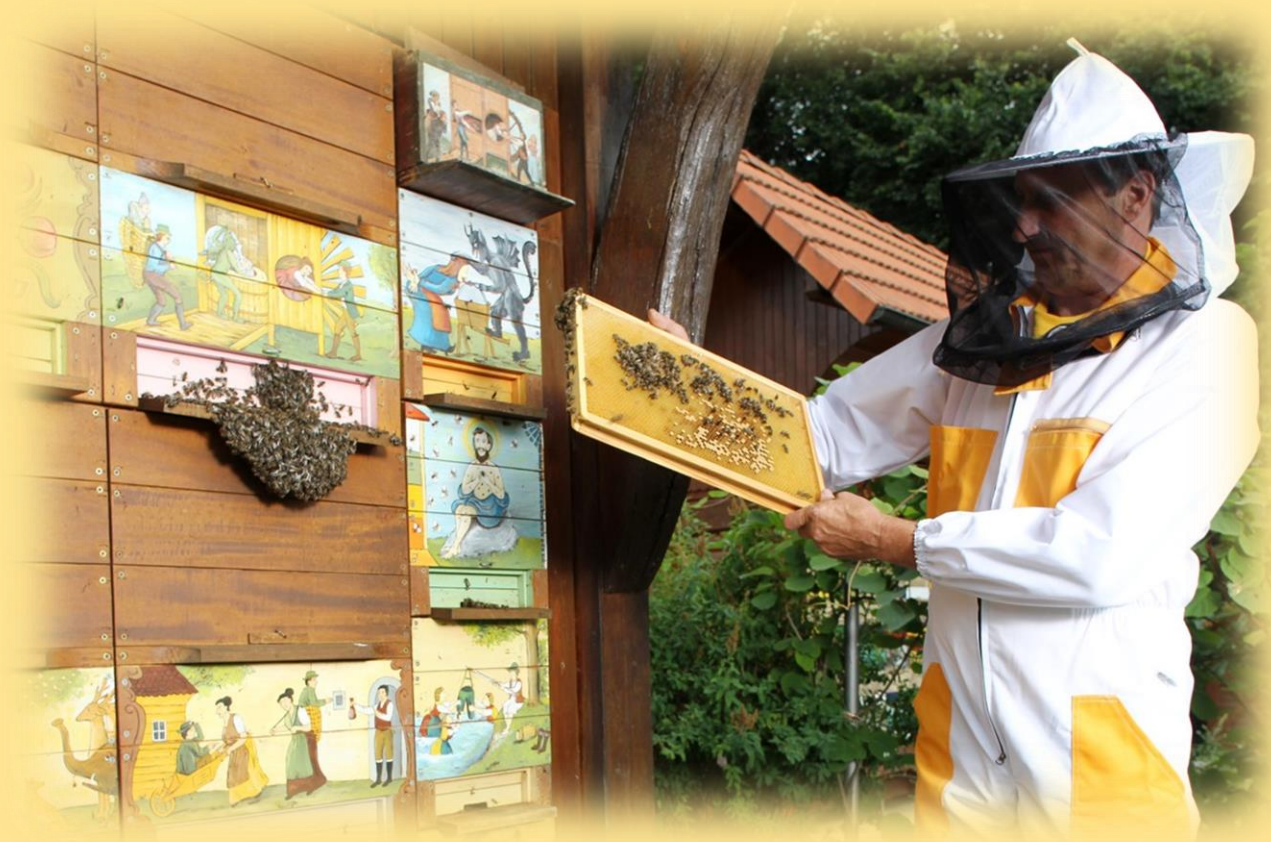
Čebelar na delu