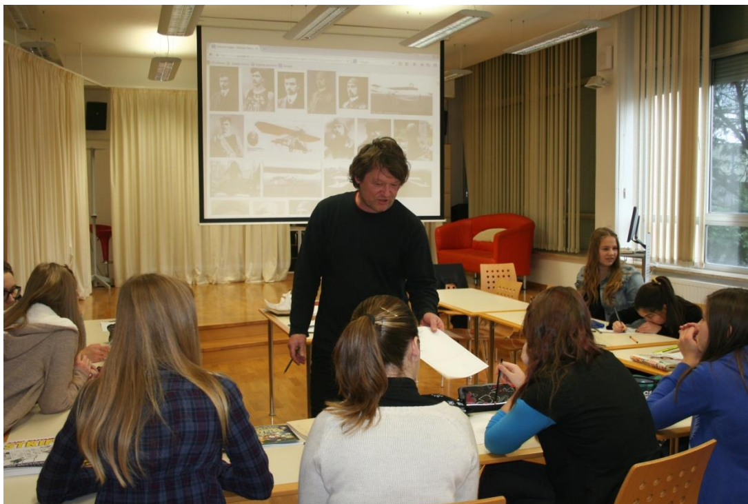
Slika 2: Delavnica stripanja o Rusjanovem letenju (foto: Laura Ozbek, januar 2015)