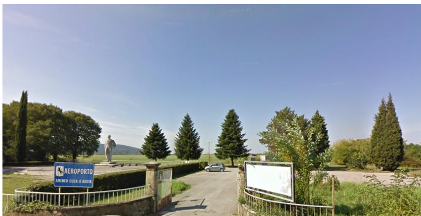
Vhod na goriško letališče, kjer sta brata izvajala poskuse letenja