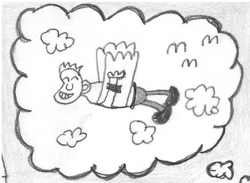
Slika 3: Izsek iz stripa avtorice Kristy Černe, januar 2015