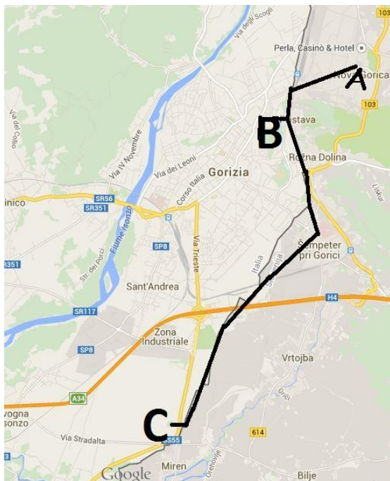
Slika 1: Začrtana kolesarska pot Po sledih Edvarda Rusjana, december 2014